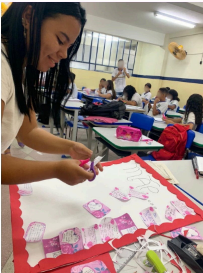
Figura 5 — Maio/2023: Oficina de bilhetes para o dia das Mães