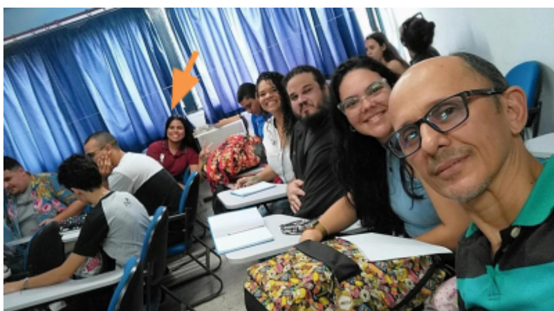
Figura 6 — Julho/2023: Evento Formativo: Pibid (núcleos Letras e Pedagogia)

Em julho, partimos para focar na produção do relatório, participar de mais formações e reorganizar os projetos que deveríamos ter desenvolvido, mas tivemos que pausar. No dia 5 de julho, estive no III Fórum Formativo Integrado para os núcleos de Letras e Pedagogia, na UFRPE, sobre Produção textual no contexto escolar, com a ministração da professora/doutora Hérica Lima.