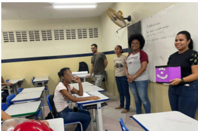
Figura 8 — Setembro/2023: Intervenção no EJA utilizando o gênero memorial

O aporte escolhido foi o trabalho com os gêneros, em especial, o memorial. O objetivo do nosso trabalho com o gênero foi, de alguma forma, utilizar a linguagem para resgatar lembranças e propor a nostalgia de bons momentos, a fim de desenvolver o gênero textual escolhido.