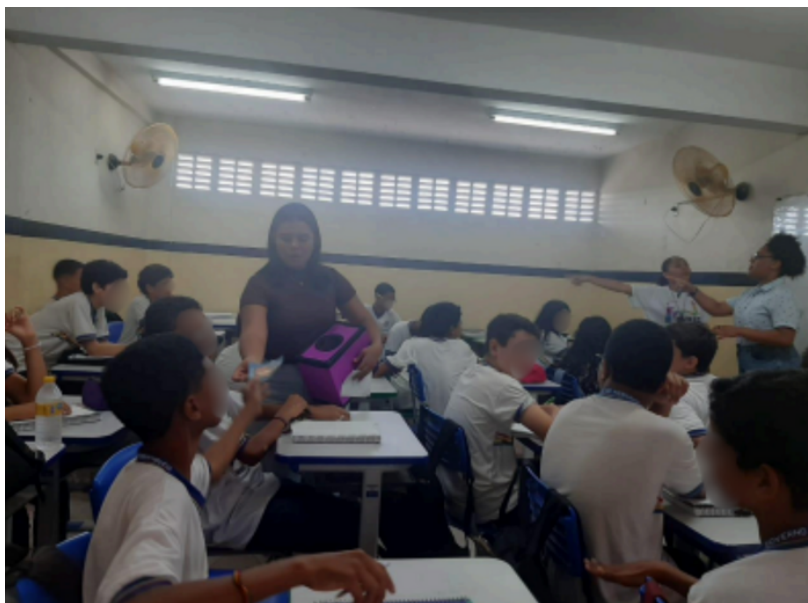
Figura 10 — Outubro/2023: Atividade lúdica envolvendo diversos gêneros textuais.