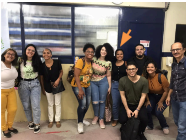
Figura 2 — Outubro/ 2022: Primeira visita à escola.

supervisora. Ficamos então com a primeira atividade, que seria feita na semana seguinte, o nosso “tour” pela escola em que trabalharíamos.