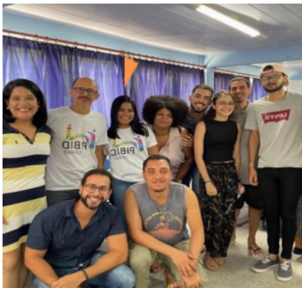
Figura 3 — Janeiro/2023: Evento formativo integrado PIBID + PRP