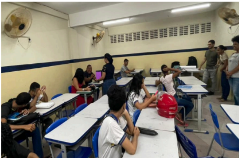
Figura 9 — Setembro/2023: Intervenção no EJA utilizando o gênero memorial