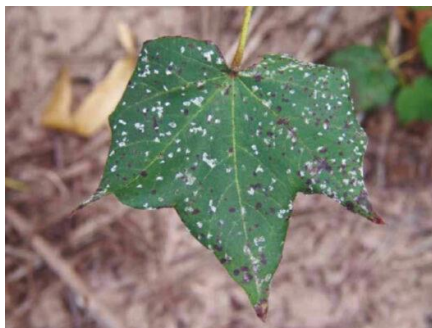
Figura 5. Ramulária do algodoeiro ( Ramularia areola )

A ramulária do algodoeiro, causada pelo fungo Ramularia areola , é uma das principais doenças foliares que afetam a cultura do algodão ( Gossypium hirsutum ), podendo resultar em desfolha prematura e, conseqüentemente, impactar negativamente a produtividade e a qualidade da fibra. A doença tem se tornado um problema crescente em diversas regiões produtoras, sendo favorecida por condições de alta umidade relativa e temperaturas moderadas. O manejo eficiente da ramulária exige estratégias integradas, sendo o controle químico com fungicidas a principal medida adotada pelos produtores para minimizar os danos econômicos (CHITARRA et al., 2020).