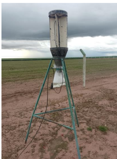
Figura 12. Montagem de armadilha luminosa.

A armadilha luminosa (Figura 12) é instalada semanalmente, utilizando um saco plástico com água e detergente. Ao anoitecer, a luz é acionada e permanece ligada durante toda a noite. Na manhã seguinte, é realizada a inspeção para identificar e quantificar os insetos capturados. O monitoramento é uma ferramenta essencial para o manejo eficiente de pragas, pois permite determinar o momento ideal para a aplicação de defensivos e a entrada nas áreas de cultivo. Durante o período de observação, os principais insetos capturados foram mariposas, com destaque para os gêneros Spodoptera spp. e Helicoverpa spp. , pragas de grande relevância agrícola para as culturas da região.