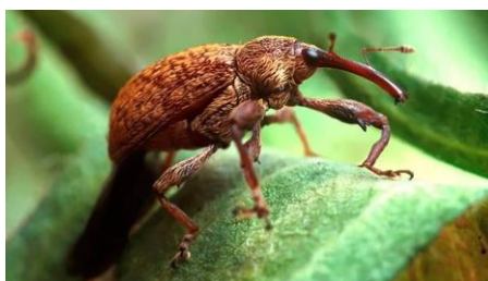
Figura 9. Bicudo-do-algodoeiro ( Anthonomus grandis )