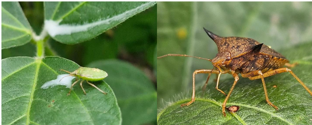
Figura 7 e 8. Percevejos verdes ( Nezara viridula ) e marrom ( Euschistus heros )

Os percevejos verdes ( Nezara viridula ) e marrom ( Euschistus heros ) representam um desafio significativo para a agricultura brasileira. Seus danos incluem a sucção de seiva, causando deformação de grãos, redução da qualidade da fibra e transmissão de patógenos (EMBRAPA, 2023a). O manejo eficaz dessas pragas exige um entendimento aprofundado dos inseticidas disponíveis e seus princípios ativos, bem como a implementação de práticas que minimizem o desenvolvimento de resistência. Estudos recentes têm se concentrado em aprimorar as estratégias de controle desses percevejos, considerando os desafios impostos pela resistência a inseticidas e a necessidade de minimizar o impacto ambiental (SOARES, 2023). No que concerne aos inseticidas e seus princípios ativos, a classificação por modo de ação continua sendo crucial. Inseticidas organofosforados, como o clorpirifós, e piretroides, como a lambda-cialotrina, são frequentemente utilizados, mas seu uso exige cautela devido ao risco de resistência (EMBRAPA, 2023). Neonicotinoides, como o tiametoxam, e diamidas, como o clorantraniliprole, representam alternativas importantes, mas também demandam manejo cuidadoso (EMBRAPA, 2023).