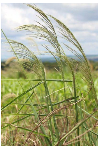
Figura 11. Capim-amargoso ( Digitaria insularis )

O capim-amargoso ( Digitaria insularis ) é uma planta daninha de difícil controle que tem se disseminado em diversas culturas agrícolas no Brasil, exigindo estratégias de manejo integradas e precisas para mitigar seus impactos. O manejo eficaz dessa planta daninha requer um entendimento aprofundado dos herbicidas disponíveis e seus princípios ativos, bem como a implementação de práticas que minimizem o desenvolvimento de resistência. No que concerne aos herbicidas e seus princípios ativos, a classificação por modo de ação continua sendo crucial. Herbicidas inibidores da enzima ACCase, como o haloxifope-p-metílico, e inibidores da enzima ALS, como o imazetapir, são frequentemente utilizados, mas seu uso exige cautela devido ao risco de resistência. O glifosato, um herbicida não seletivo amplamente utilizado, também apresenta casos de resistência em populações de capim-amargoso (ALMEIDA; DURIGAN, 2017; GEMELLI; CARRIJO; MARTINS, 2017; PEREIRA BRAZ et al., 2011).