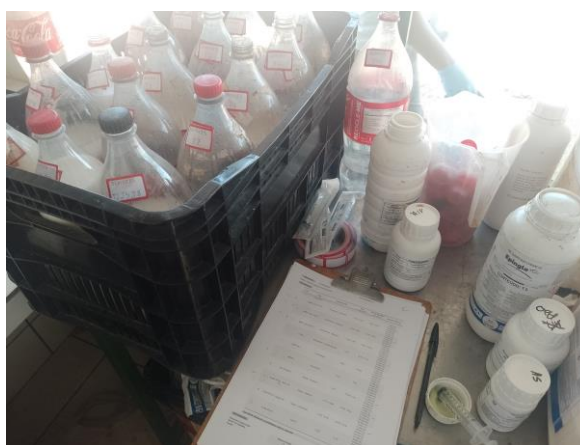
Figura 2. Dosagem de defensivos

Durante o estágio realizado na Ceres Consultoria Agronômica, a principal atividade que desempenhei foi a dosagem e preparação dos defensivos a serem aplicados nos ensaios agronômicos. A periodicidade das aplicações, a seleção de produtos e princípios ativos utilizados, bem como as dimensões e avaliações realizadas, foram determinadas de acordo com a finalidade específica de cada ensaio. Esses ensaios podem ser contratados por empresas para avaliações de campo ou conduzidos internamente pela Ceres Consultoria Agronômica com o objetivo de gerar dados técnicos para subsidiar seu time de consultores.