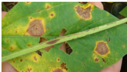
Figura 3. Mancha-alvo na soja ( Corynespora cassiicola )

A mancha-alvo, causada pelo fungo Corynespora cassiicola , é uma das principais doenças foliares da soja ( Glycine max ), podendo resultar em reduções significativas na produtividade. O patógeno tem ampla distribuição geográfica, e sua incidência tem aumentado nas últimas safras, devido ao uso intensivo de cultivares suscetíveis e à adoção de sistemas de cultivo que favorecem sua disseminação (EMBRAPA, 2025).