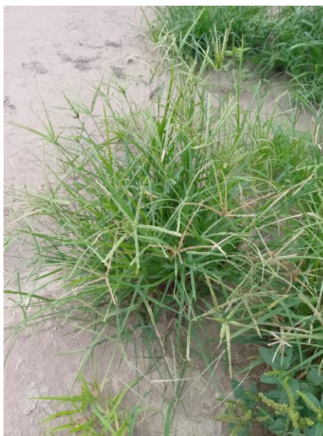
Figura 10. Capim pé-de-galinha ( Eleusine indica )

O controle do pé-de-galinha ( Eleusine indica ), uma planta daninha de grande adaptabilidade e impacto em diversas culturas, demanda estratégias eficazes, com destaque para o uso de herbicidas. A seleção e aplicação correta desses produtos são cruciais para o manejo da planta, considerando os desafios impostos pela resistência a herbicidas e a necessidade de minimizar o impacto ambiental (VIDAL; MEROTTO JÚNIOR; KALSING, 2006).