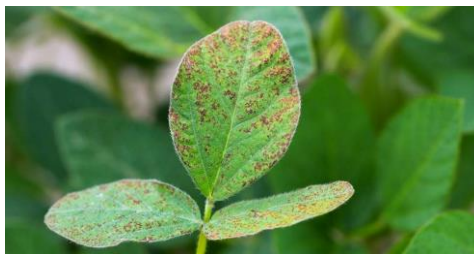
Figura 4. Ferrugem-asiática da soja ( Phakopsora pachyrhizi )