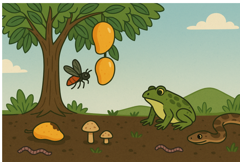
Figura 3 - Teia alimentar