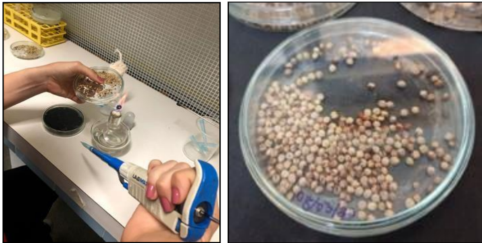
Figura 2. Colonização da M. phaseolina em Sorgo ( Sorghum bicolor ).

direto e depositados junto as sementes de feijão-caupi.