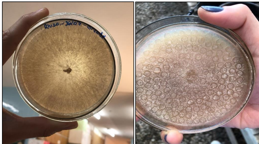
Figura 3. Colonização da R. Solani e discos de micélos.