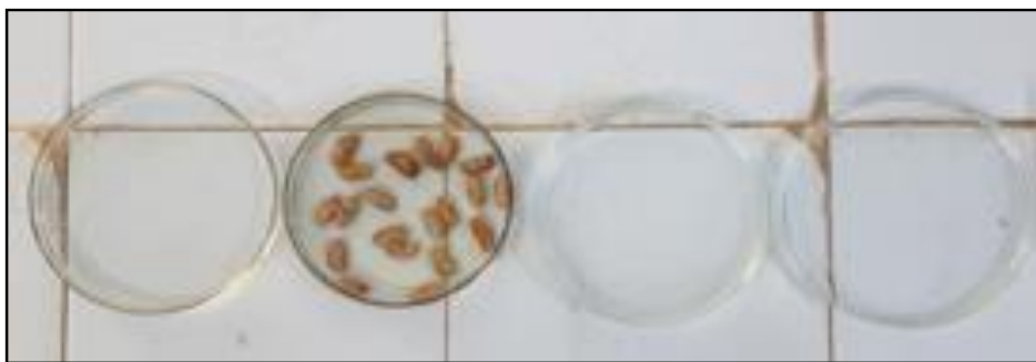
Figura 3. Desinfestação das sementes dos feijões em álcool 70°, hipoclorito 2% e em água destilada esterilizada.

No experimento 1, foram dispostos quatro grãos de sorgo colonizados pela M. phaseolina por cova, dois grãos de sorgos em baixo e dois grãos de sorgo em cima da semente do feijão, uma adaptação da metodologia descrita por García et al. (2017). Já no experimento 2, foram colocados dois discos o micélio do fungo R. Solani , dispostas junto as sementes de feijão-caupi, em cada cova de 2cm. Além disso, foram utilizadas testemunhas de cada cultivar sem a exposição ao fungo, visando confirmar a ocorrência da doença nos ensaios e obter a emergência de cada cultivar sem a presença do fungo.