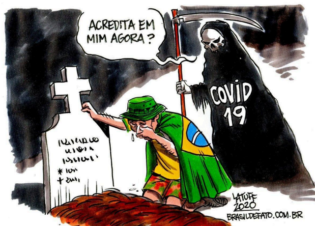
Imagem 2: a tradicionalidade composicional nas charges sobre a COVID-19

Logo, do ponto de vista composicional, observa-se uma articulação consistente entre os elementos verbais e não verbais. Os traços caricaturais das personagens, bem como suas posturas corporais e expressões faciais, dialogam com o enunciado escrito, que recorre a uma linguagem mais informal, comum em charges, com destaque para o uso expressivo dos sinais de pontuação, os quais potencializam o efeito humorístico.