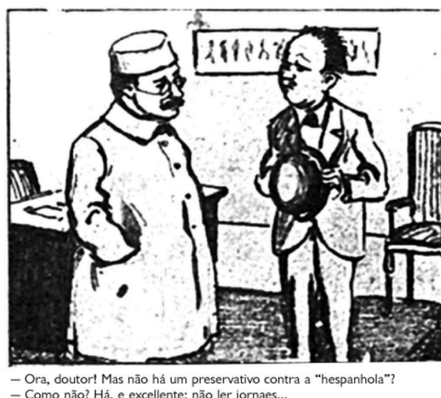
Imagem 1: a tradicionalidade composicional nas charges sobre a Gripe Espanhola