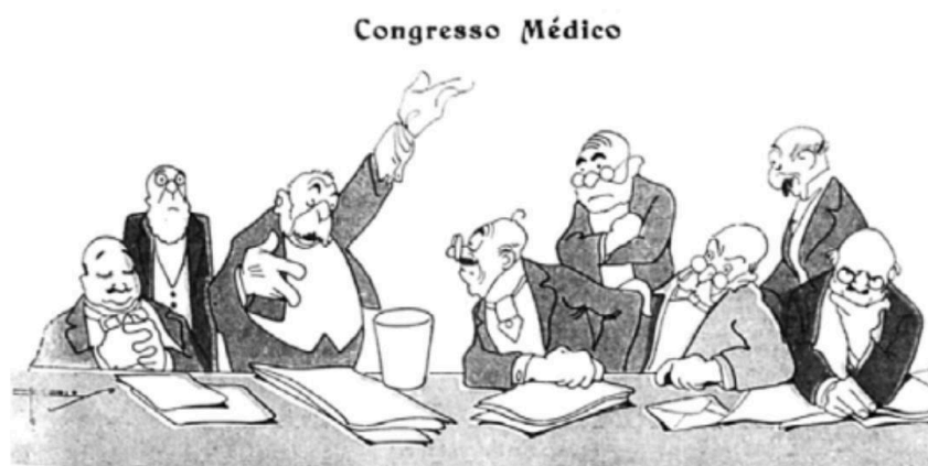
Imagem 3: exemplo do emprego de juntores em charges da Gripe Espanhola

O sábio magro: – Não há motivos para que nos alarmemos com a moléstia que dia-a-dia se espalha e domina esta cidade! Segundo telegramas, um sábio francês espera telegrama de Túnis, para descobrir em Paris a vacina da influenza espanhola. Esperemos com calma essa descoberta, porque os sobreviventes poderão imunizar-se quando o mal reaparecer.