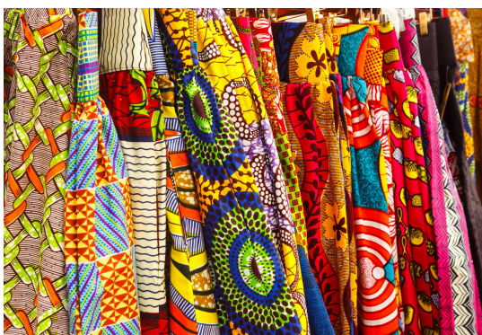
Imagem 2: Tecido Kente ou Capulana africana

de um sistema mais amplo de significação cultural que inclui a literatura, a arte e a música. Assim, a moda reflete e influencia simultaneamente outras formas de expressão cultural, criando um diálogo contínuo entre o vestuário e a cultura.