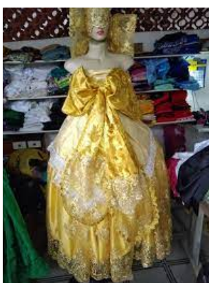
imagem 6: Roupas de “ festa” usada nos festejos da casa ( direita)

Imagem 5: Roupas Ritualísticas, oxum (esquerda)