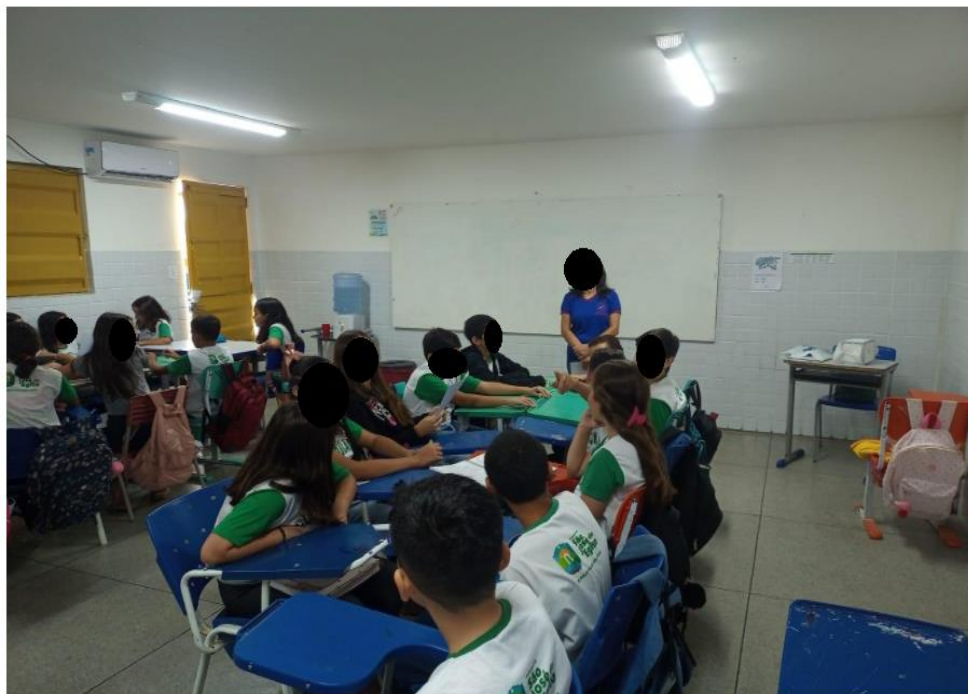
Figura 3 – Formação dos grupos

Em seguida foi realizada a formação dos grupos (Figura 3), para apresentar a atividade prática.