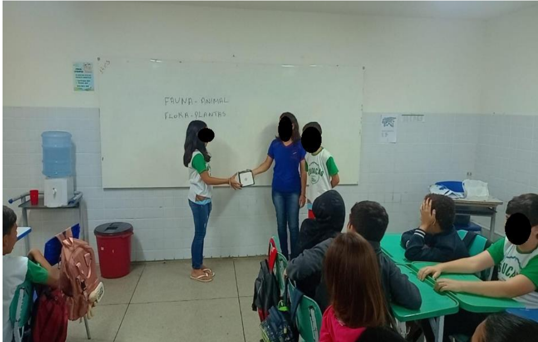
Figura 5 – Realização da atividade a partir da dinâmica do jogo passa-repassa

Nesse momento foi entregue um dado a um dos representantes do grupo para ser lançado.