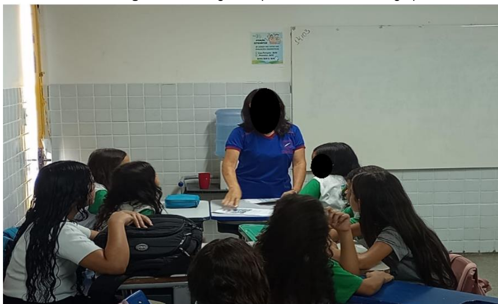
Figura 4 – Entrega da apostila a cada um dos grupos

Observamos que os estudantes e a professora interagiram de maneira reflexiva o tema discutido.