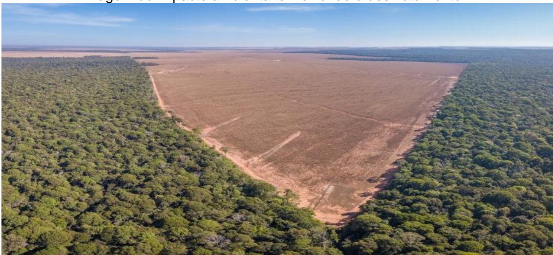
Imagem de impacto ambiental envolvendo o desmatamento

O aumento populacional nas cidades, aliado a uma sociedade extremamente consumista, faz gerar vários problemas ambientais. O lixo urbano é um desses problemas, ele pode ser de origem domiciliar (sobras de alimentos, papéis, plásticos, vidros, papelão), origem industrial (apresenta constituição variada, entre gasosa, líquida ou sólida), o hospitalar (seringas, agulhas, curativos, gases, ataduras, peças atômicas, etc.) e o lixo desse século: o tecnológico (pilhas e aparelhos eletrônicos em geral). Assim, a produção de lixo é uma ação humana causadora dos impactos ambientais negativos identificados no mundo atual.