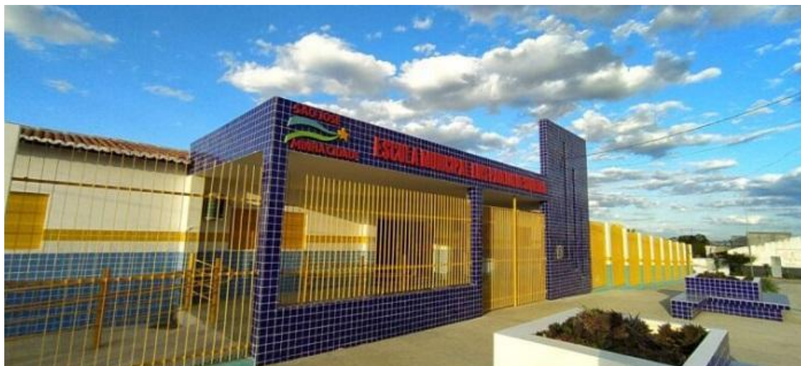
Figura 1 – Escola Fundamental Luís Paulino de Siqueira

Ela foi desenvolvida em uma escola pública localizada na cidade de São José do Egito-PE, escolhida por não apresentar dificuldades ou impedimentos para a realização do trabalho, envolvendo alunos da disciplina de ciências do 6º ano do Ensino Fundamental II, no ano de 2025. Fundada em 23 de 06 de 1997, a Escola Luís Paulino de Siqueira (Figura 1) é uma instituição pública localizada em São José do Egito, Pernambuco, oferecendo um ambiente educativo acessível e inclusivo. Com aulas presenciais e diurnas, atendendo alunos dos anos iniciais e finais do ensino fundamental.