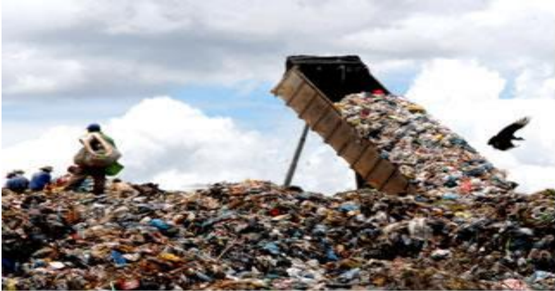
Imagem de impacto ambiental envolvendo a produção de lixo