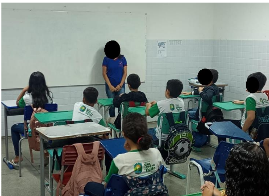
Figura 2 – Professora explicando o conteúdo aos estudantes

No primeiro momento a professora fez uma prevê apresentação, em seguida uma explicação sobre o tema a ser trabalhado.