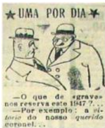
Figura 1: crítica no Jornal O Nacional .