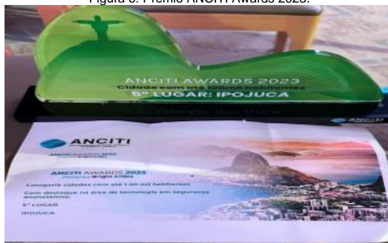
Figura 6: Prêmio ANCITI Awards 2023.