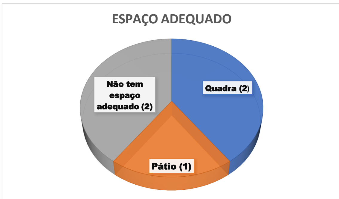
Gráfico 2: Informações sobre infraestrutura (espaço adequado) das escolas.

Em relação a parte da infraestrutura (espaço adequado) e materiais para as aulas de Educação Física foi respondido da seguinte forma: