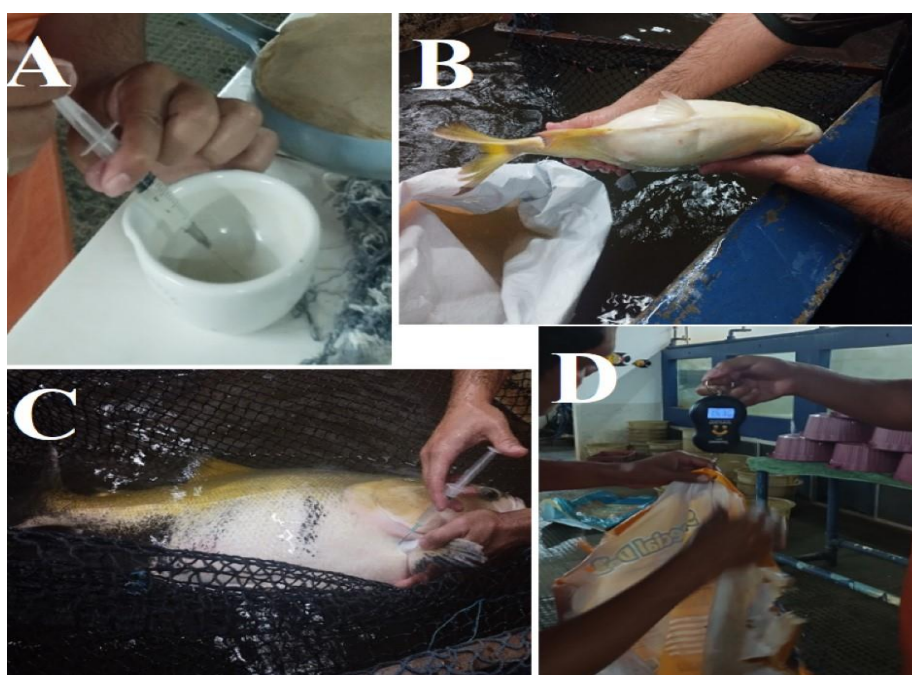
Figura 9 – (A) Preparação do hormônio; (B) Peixe com barriga abaulada; (C) Aplicação do hormônio; (D) Pesagem dos reprodutores.

Após a segunda aplicação é necessário aguardar a hora-grau, que é a estimativa para o momento da desova. Cada espécie apresenta um valor, podendo ter grande variação. Para o cálculo de hora-grau é realizada soma da temperatura da água a cada hora de monitoramento. Por exemplo, caso o valor de hora-grau de uma determinada espécie é 200, então se a temperatura da água estiver 25 °C e se manter constante, a desova iria ocorrer aproximadamente 8 horas após a segunda indução hormonal (Figura 9 – C).