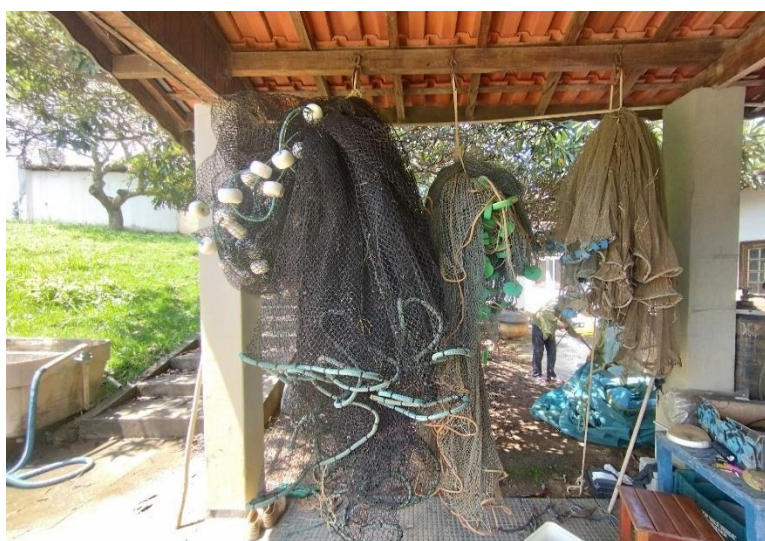
Figura 4 – Redes de arrasto utilizadas na piscicultura.

A malha da rede de 50 metros é de 50 mm, a de 30 metros é de 30 mm e a de alevino de 20 metros é de 10 mm.