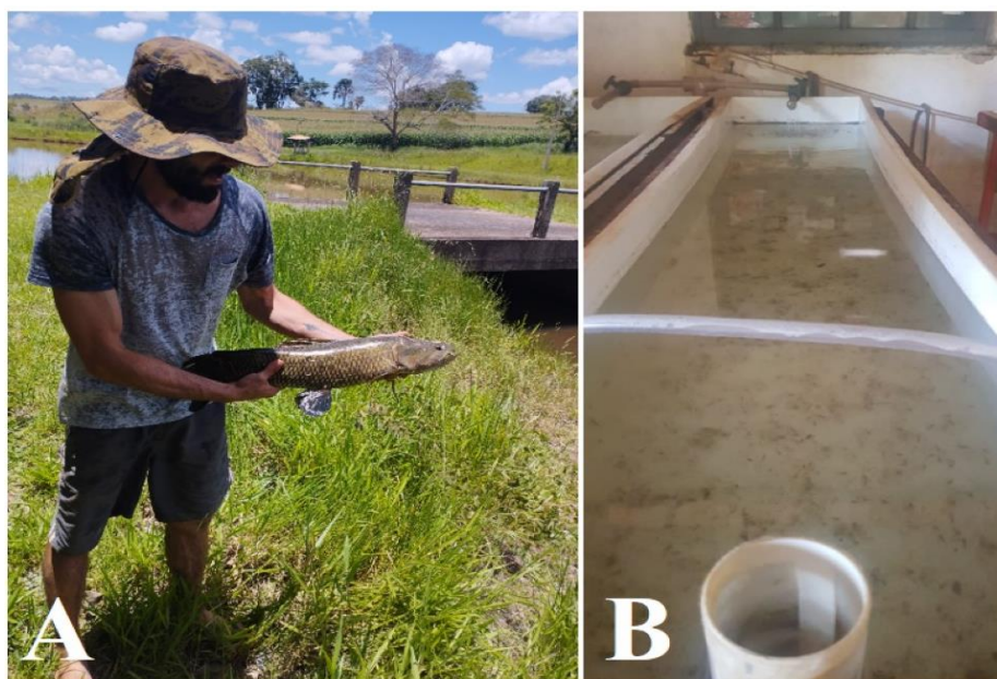
Figura 6- (A) Matrix de Trairão; (B) Caixa de Alevinos em ambiente controlado.

Na fazenda são utilizados três tipos de reprodução, que são: natural, seminatural e artificial (fertilização a seco). Na reprodução natural ocorre no próprio tanque onde os peixes estão alocados, sem necessidade de nenhum tipo de intervenção. Assim, os ovos são então coletados e levados para as incubadoras até a eclosão, sendo depois mantidas em caixas d'água com ambiente controlado, essas caixas medem 0,50 metros de largura por 2,0 metros de comprimento, na piscicultura o Trairão amazônico ( Hoplias lacerdae ) é a espécie utilizada nesse tipo de reprodução.