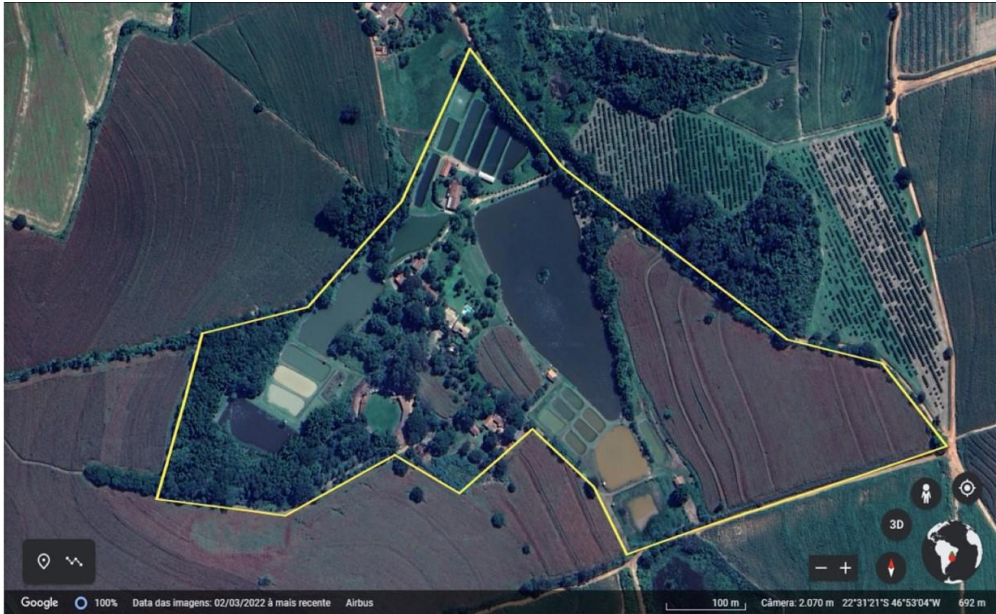
Figura 1- Vista aérea com destaque em amarelo delimitando a Sede da Piscicultura Brumado na cidade de Mogi Mirim, SP.