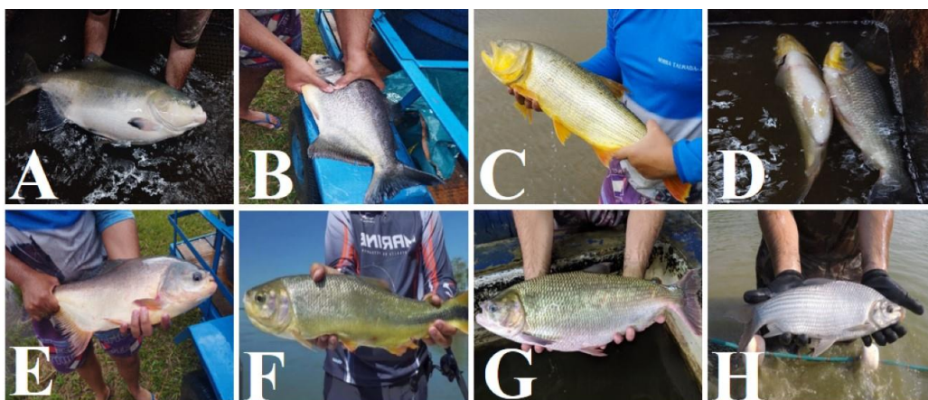
Figura 10 – Peixes da tabela 1, (A) Tambaqui; (B) Pacu; (C) Dourado; (D) Piauçu; (E) Pirapitinga; (F) Piraputanga; (G) Matrixã; (H) Curimatá.

Para a produção de híbridos são cruzadas duas espécies diferentes, tendo como objetivo obter proles com características superiores aos parentais, o chamado “vigor híbrido”. Para nomenclatura comum do híbrido, é utilizado o primeiro nome da fêmea e o segundo nome do macho, como visto na tabela 2.