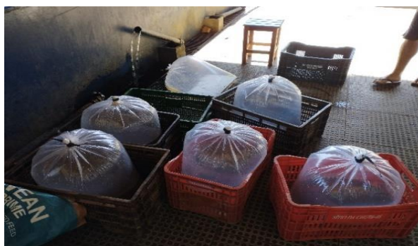
Figura 11 – larvas embaladas com oxigênio em caixas de plástico.

Após a eclosão das larvas, estas são mantidas nas incubadoras até consumirem completamente o vitelo, quando então estão prontas para serem soltas nos tanques adubados. Para o transporte, as larvas são alocadas em sacos (um saco por incubadora) com oxigênio com uma proporção de 40/60 onde 40 % é água e 60 % é oxigênio puro, e colocadas em caixas de plástico para evitar a movimentação e mortalidade (Figura 11).