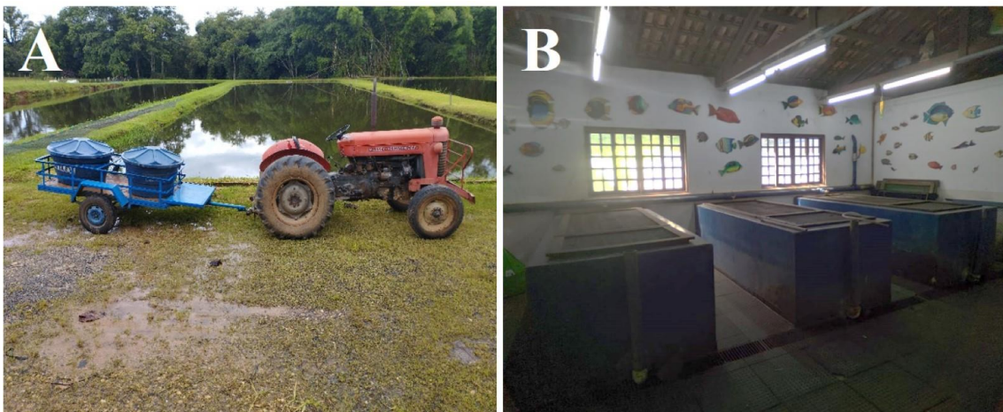
Figura 5 – (A) trator com reboque com as caixas d'água para transporte dos reprodutores; (B) tanques de alvenaria para recepção e manutenção dos reprodutores.

Para capturar os reprodutores é utilizada uma rede de arrasto com saco, sendo então selecionados aqueles que estão com características que indicam que estão aptos a reprodução para fêmeas é observada três fatores, barriga abaulada (maior que o normal), papila avermelhada e papila saltada. Para os machos, se massageia um pouco a barriga se sair um pouquinho de sêmen está pronto para a reprodução. Os peixes são então conduzidos até o laboratório de reprodução em duas caixas d'água de 250 litros (uma para machos e outra para fêmeas) em um reboque puxado por um trator (Figura 8). Das caixas para os tanques de alvenaria no laboratório os peixes são transportados em sacos plásticos para evitar machucar os animais (Figura 8). No laboratório, os peixes são mantidos separados em machos e fêmeas para então ser dado início ao processo de reprodução.