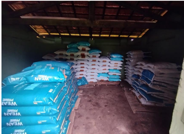
Figura 16 – Local de armazenamento de ração