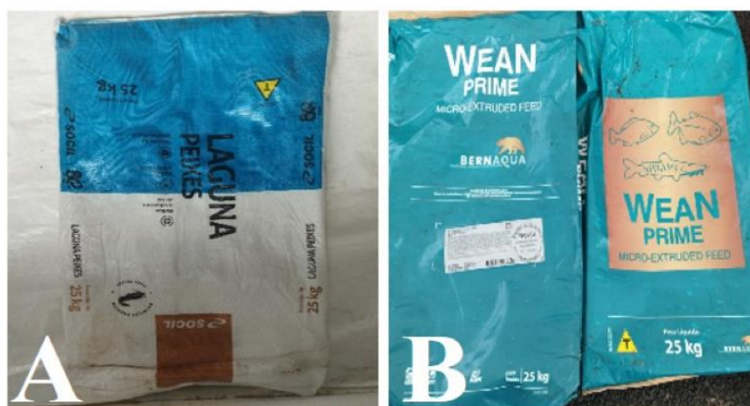
Figura 15 – Rações utilizadas na alimentação dos peixes (A) LAGUNA peixes; (B) BERNAQUA.

Na piscicultura, a rações utilizadas são das empresas BERNAGUA E LAGUNA PEIXES (SOCIL), como visto na figura 14.