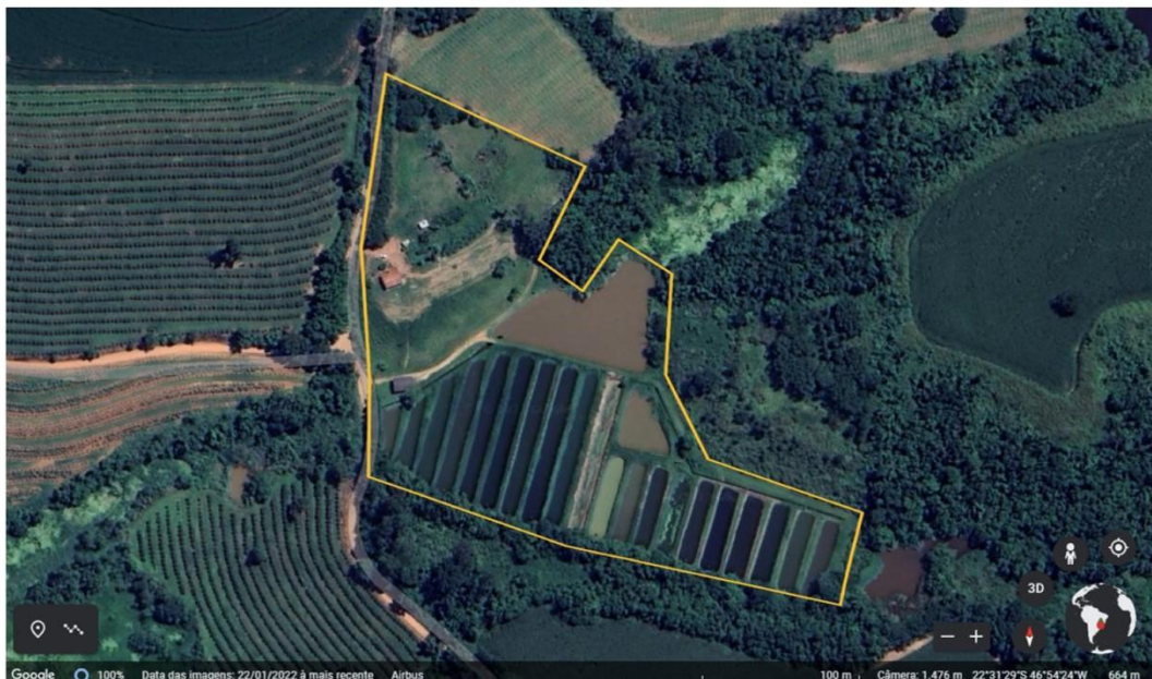
Figura 2 – Vista aérea com destaque em amarelo da unidade Aurora, parte da Piscicultura Brumado.