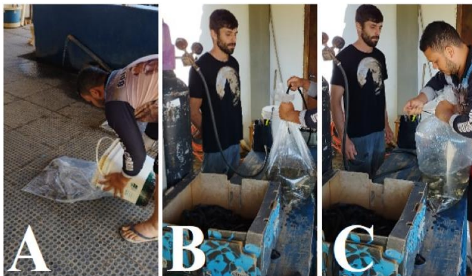
Figura 14 – (A) colocando os peixes no saco; (B) colocando o oxigênio e o elástico; (C) amarrando o saco.