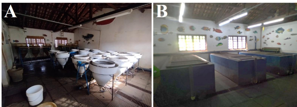
Figura 3 – (A) setor II incubadoras; (B) setor I tanques de alvenaria.