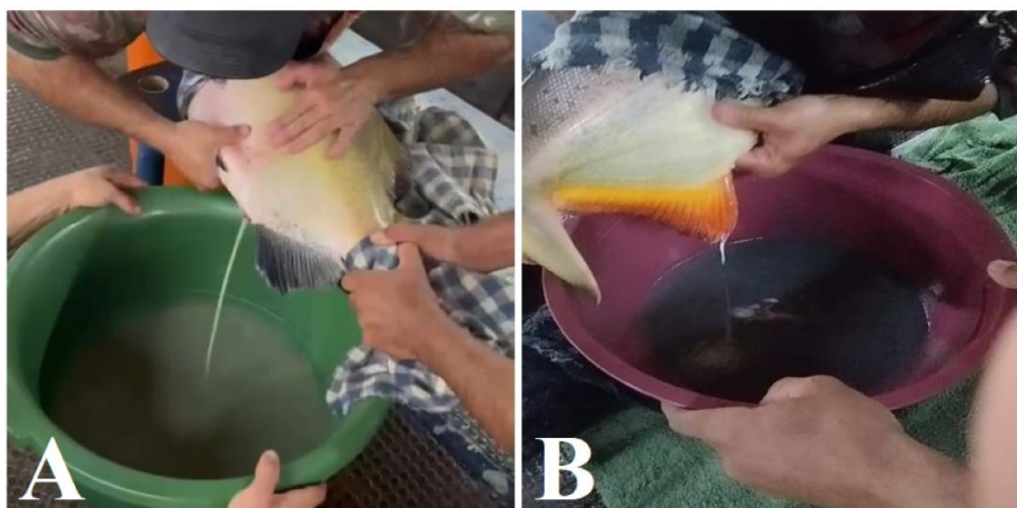
Figura 8 – (A) extrusão dos ovos; (B) Fertilização dos ovos.