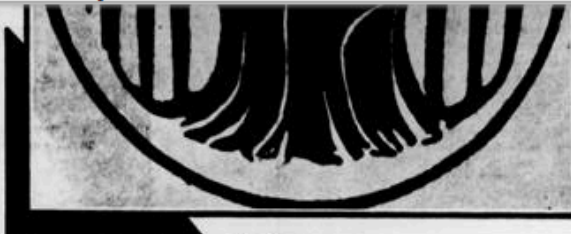
A bengala de Bengala, que simboliza a longevidade e o crescimento contínuo, é o logotipo oficial do Ano Internacional do Idoso

Lúcio Lins — O problema começou há muitos anos atrás, e vem se agravando com a progressiva deterioração dos costumes. Nas tribos selvagens, os velhos são ouvidos porque eles são os relíquias dos costumes tribais, e como não têm a escrita, ou outros meios de informações, eles ouvem as histórias dos anciãos. O próprio nome "semeado" vem dos romanos, que tinham uma deferência toda especial por seus velhos, pois os idosos simbolizavam a maturidade e a sabedoria, principalmente política. Com o progresso, as técnicas de Marketing, o velho, até na televisão, fica em papel secundário. Quando vemos um anúncio de sucesso é sempre a veiculação do jovem. O problema do amor é tabu para o velho; ele é