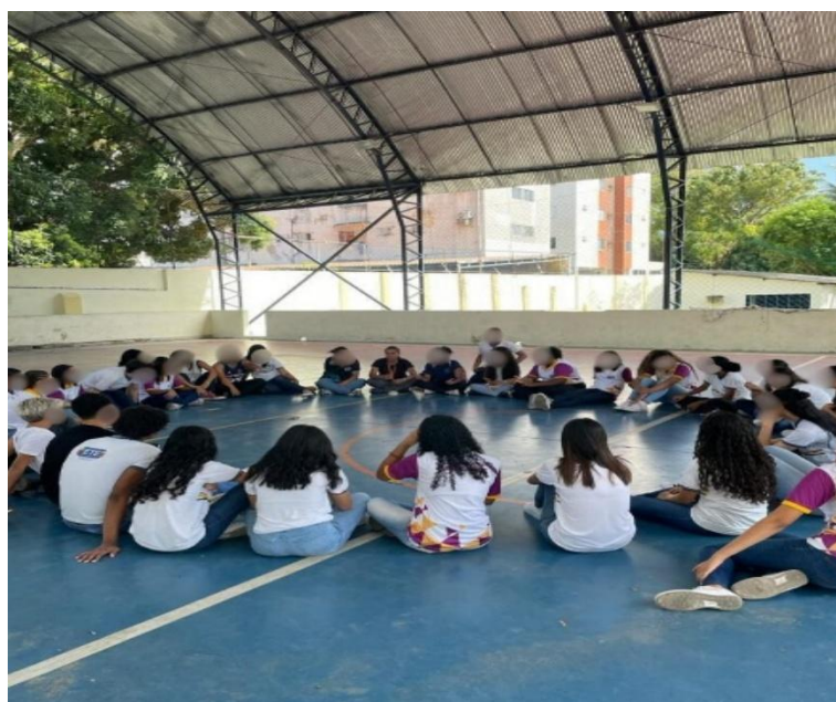
Figura 3: Dialogando sobre o atletismo

Na sequência, antes de seguir para as atividades práticas, reunimos todos os alunos em um círculo no centro da quadra para um momento de conversa. A proposta era entender o que eles já sabiam sobre o atletismo e suas provas, tanto de pista quanto de campo. Durante esse momento, mostramos algumas imagens relacionadas ao esporte e pedimos que identificassem as provas, dissessem se já tinham visto alguma delas, onde foi como por exemplo: na televisão, nas Olimpíadas e se conheciam algum atleta. As respostas surgiram naturalmente e foram revelando diferentes níveis de familiaridade com o atletismo, o que enriqueceu muito a troca entre eles.