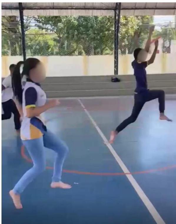
Figura 11: Salto em distância

Nas atividades de saltos, começamos solicitando para os alunos ficarem com uma perna só saltando e mantendo o equilíbrio, em seguida que realizassem uma pequena corrida e no final um salto da forma que desejarem, posteriormente o professor limitou uma linha para saltar, como a tábua de salto que existe em competições, e através das marcações da quadra e cones, eles