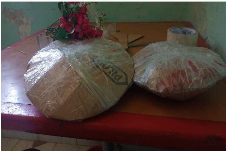
Figura 7: Disco de papelão

Produção: Inicia-se fazendo com o prato, dois círculos de igual tamanho, na sequência recorta ambos, e com uma tampa de garrafa de água, faz uma abertura no meio do círculo e faz um corte tipo V, na sequência faz a união dos dois lados proporcionando a realização de uma leve curva, caracterizando o formato do disco. A próxima etapa é o preenchimento da sacola plástica com área para que proporcione um certo peso, ao colocar areia com uma quantidade que der para fica dentro das duas partes do círculo do disco, dar-se um nó e envolve em outra sacola e veda-se com fita adesiva para ficar firme. Para finalizar a produção coloca o saco entre as duas partes do círculo, vedando as bordas com fita adesiva e para deixa de mais composto passa fita em volta do disco todo.