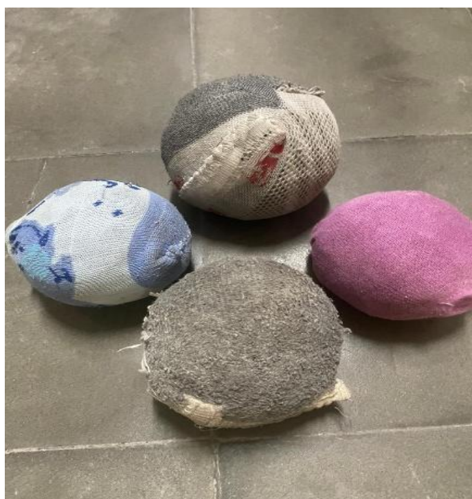
Figura 5: Pesos de areia

Para a realização desta atividade foram confeccionados pesos de areia e discos de papelão, e para os saltos utilizamos as marcações da quadra. Para a confecção do peso foram utilizados os seguintes materiais: areia, fita adesiva, meia, sacola plástica, um balde com água.