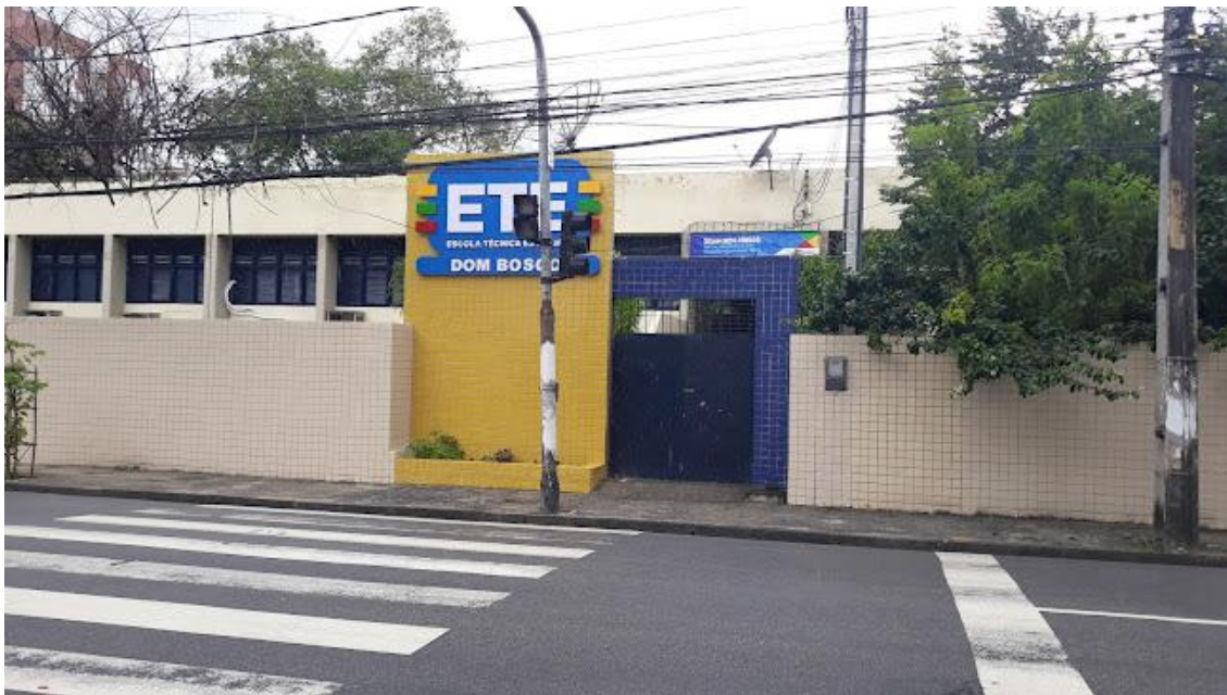
Figura: 1 Escola Técnica Estadual Dom Bosco

A instituição de ensino que desenvolvemos as intervenções do Núcleo Educação Física foi a Escola Técnica Estadual Dom Bosco, no período de outubro de 2022 à março de 2024.