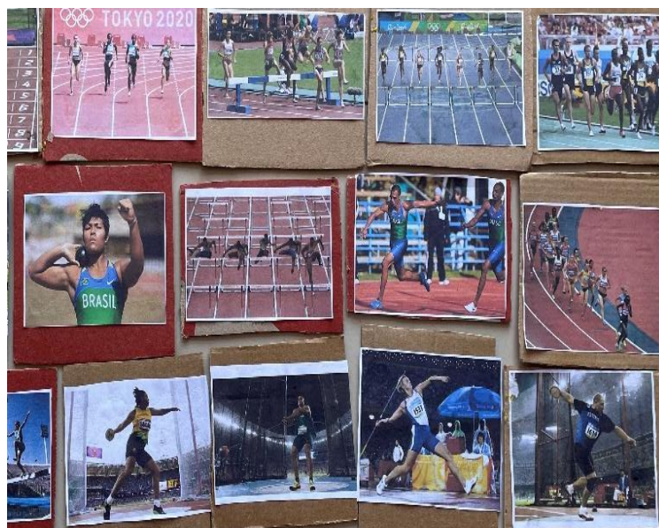
Figura 4: Imagens das provas do atletismo