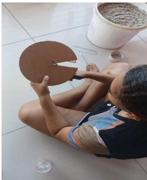
Figura 6: Confeccionando o Disco.

Materiais: areia, fita adesiva, sacola plástica, papelão, tesoura e um prato redondo para fazer o molde.