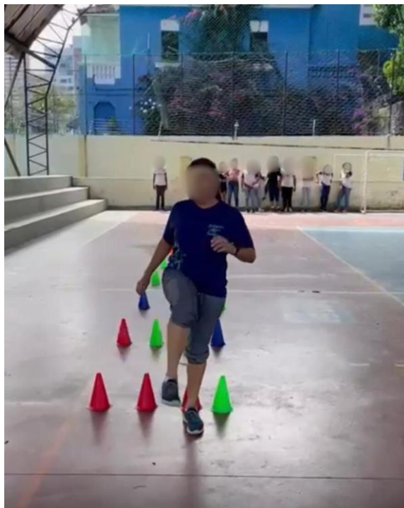
Figura 13: Barreiras de cones

Para essa atividade, montamos barreiras utilizando cones, simulando obstáculos parecidos com os usados em provas de atletismo. No início, os estudantes passaram por cada barreira de forma controlada: atacando o obstáculo com uma perna e passando com a outra, como acontece nas competições, só que andando. Depois que todos se familiarizaram com o movimento, espalhamos as barreiras de cones pela quadra, criando um percurso mais livre e dinâmico. Sempre que os estudantes se deparavam com uma barreira no caminho, faziam a ultrapassagem conforme haviam aprendido.