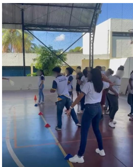
Figura 10: Arremesso usando a técnica