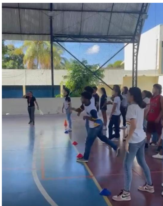
Figura 9: Arremesso do livre