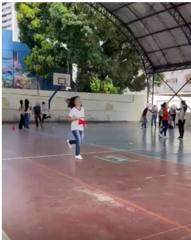
Figura 12: Corrida em circo

A atividade consistia em uma prova de revezamento, pensada para trabalhar a agilidade, condicionamento físico e o espírito de equipe. Cada grupo ficou posicionado em uma das extremidades da quadra, e os próprios alunos organizaram a ordem dos participantes dentro da equipe. Ao sinal do professor, o primeiro estudante de cada grupo iniciava a corrida, contornando a quadra no sentido anti-horário. Ao completar a volta, ele entregava o cone (que