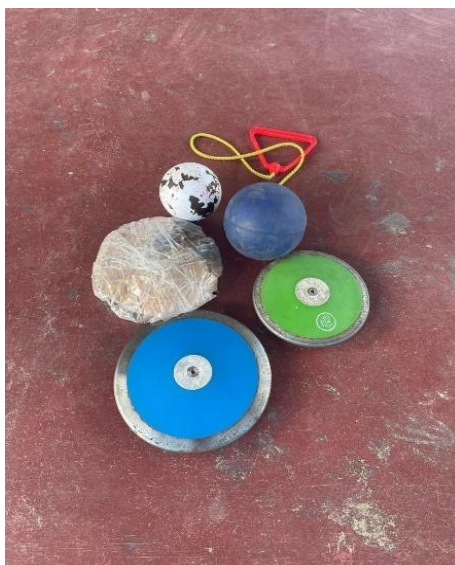
Figura 8: Outros materiais utilizados

Produção: Inicia-se fazendo com o prato, dois círculos de igual tamanho, na sequência recorta ambos, e com uma tampa de garrafa de água, faz uma abertura no meio do círculo e faz um corte tipo V, na sequência faz a união dos dois lados proporcionando a realização de uma leve curva, caracterizando o formato do disco. A próxima etapa é o preenchimento da sacola plástica com área para que proporcione um certo peso, ao colocar areia com uma quantidade que der para fica dentro das duas partes do círculo do disco, dar-se um nó e envolve em outra sacola e veda-se com fita adesiva para ficar firme. Para finalizar a produção coloca o saco entre as duas partes do círculo, vedando as bordas com fita adesiva e para deixa de mais composto passa fita em volta do disco todo.