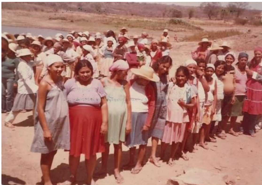
Figura 2- Agricultoras grávidas trabalhando na Frente de Emergência na seca de 83.