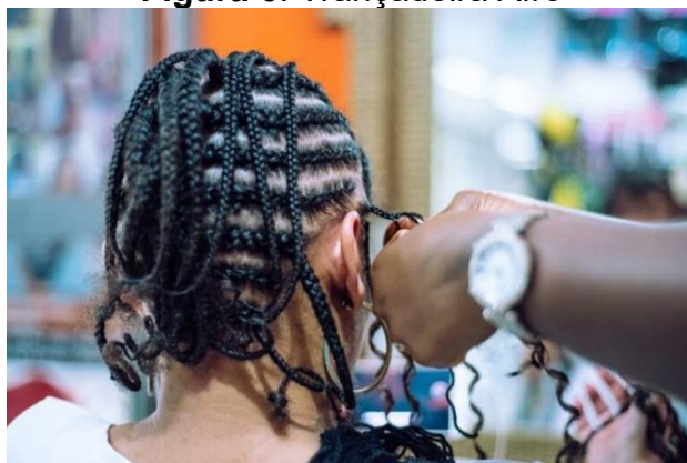
Figura 6: Trançadeira Afro

Na Comunidade Sítio Boa Vista, a vivência das práticas culturais está imbricada à memória dos ancestrais, à vida comunitária, concretizada na partilha de símbolos, da sementeira e da colheita, das tradições (Gomes, 2017). Em referência a cultura de subsistência, as mulheres quilombolas do Sítio Araçá, auxiliam na agricultura familiar como uma das fontes de renda, artesanatos, remédios caseiros e populares na cidade e uma parte são trancistas e além de desenvolverem a arte também promovem cursos para que tem interesse.