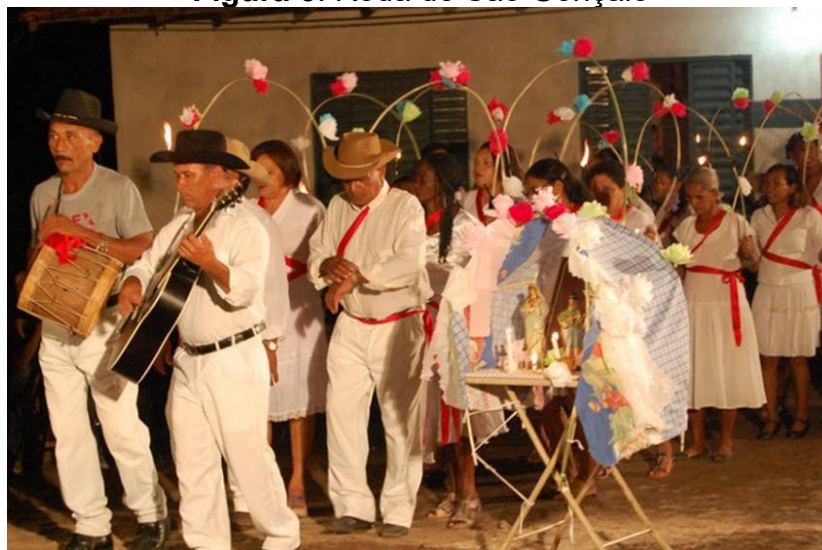
Figura 5: Roda de São Gonçalo

Outra manifestação cultural vivenciada no Sítio Araçá são as Rodas de São Gonçalo, de origem portuguesa, difundiu-se no nordeste brasileiro, após ter-se inserido na cultura deste país a partir do século XVIII. No Araçá são realizadas em cumprimento a uma promessa ao Santo da devoção, após a obtenção da graça, com a execução diversificada de coreografia a depender do lugar onde acontece, de rezas e de oferta gratuita de refeições aos presentes, configurando-se, pois, como uma manifestação lúdico-religiosa e apresentando-se, na maioria das vezes, com caráter popular e rural, como mostrado na Figura 5 :