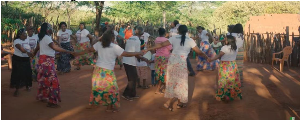
Figura 3: Samba de roda do sítio Boa Vista