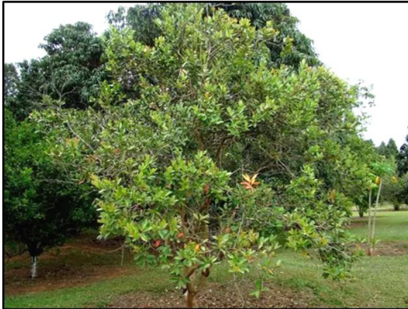
Figura 2: Árvore Araçá