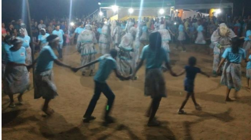
Figura 4: Reisado Sítio Lago Comprida

integram o grupo de reisado de matriz africana do quilombo da Lagoa Comprida - este ainda não certificado”. Na figura 4 observa-se o Reisado de Lagoa Comprida: