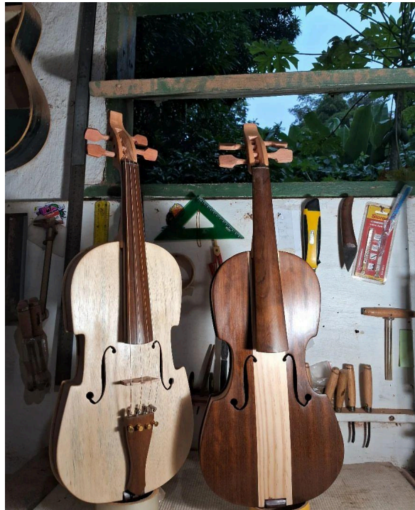
Figura 6 - Rabecas do luthier Valério Bizunga.