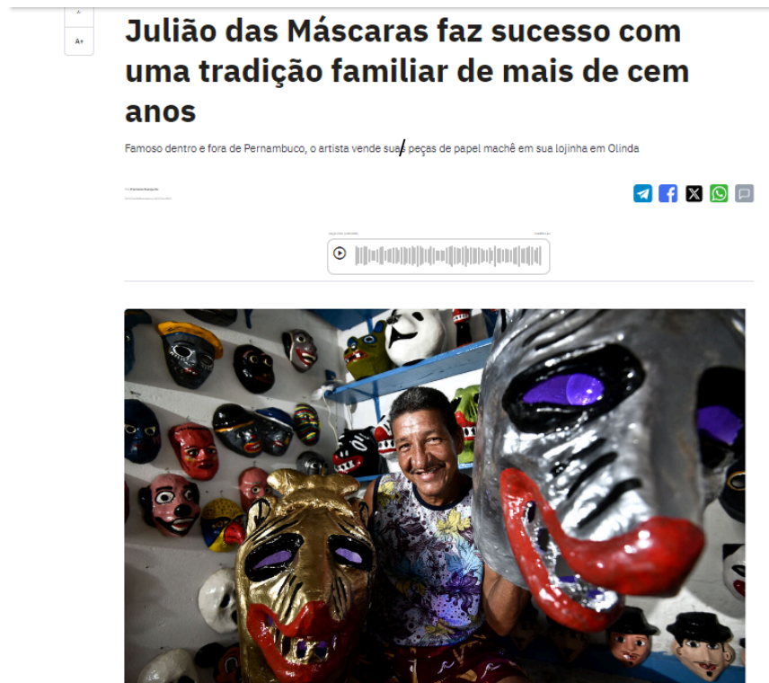
Figura 5 - Título de reportagem da Folha PE.