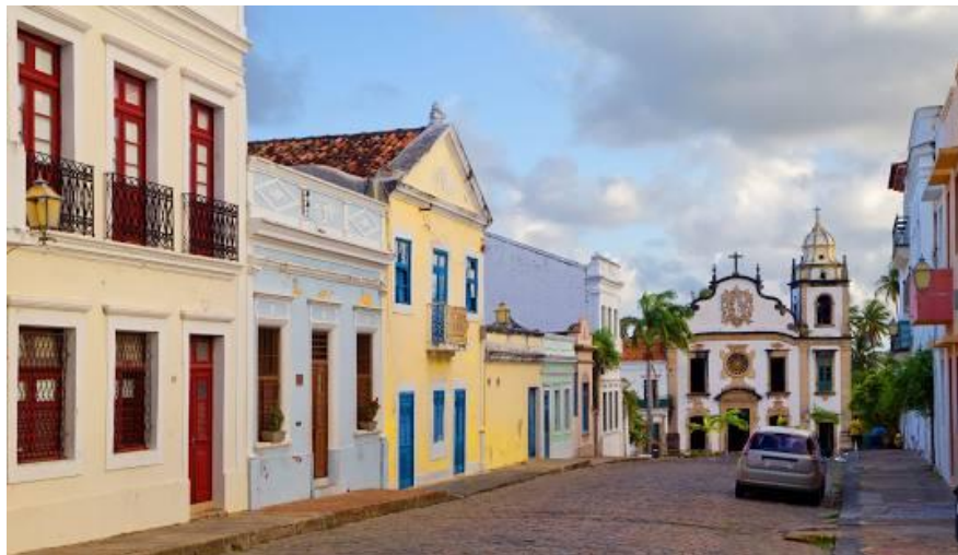
Figura 1 - Imóveis do Sítio Histórico de Olinda