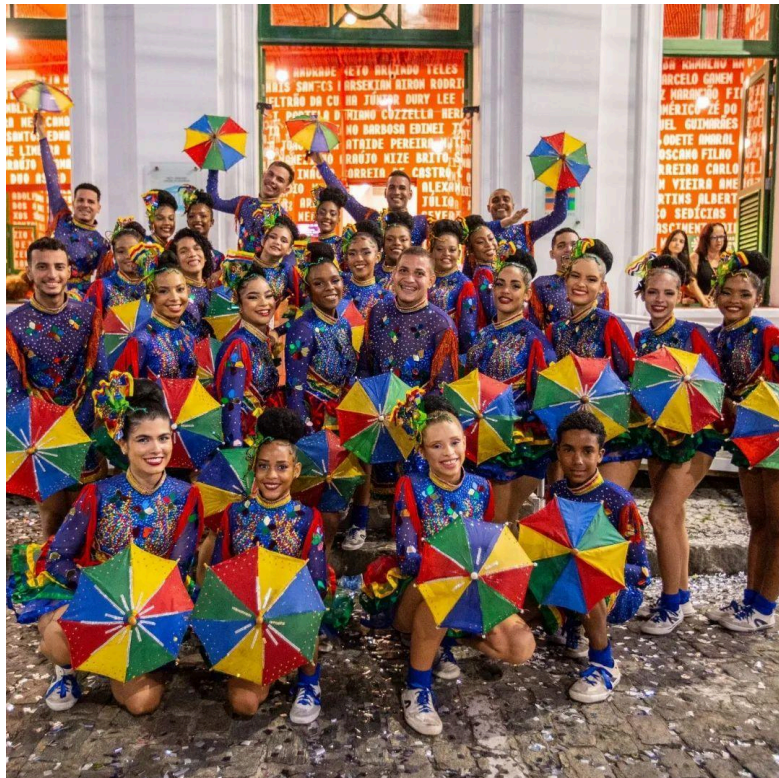
Figura 7 - Passistas Cia Brasil por Dança