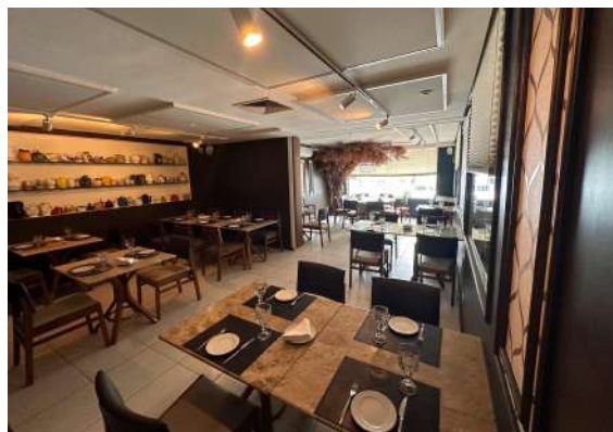
Figura 3 - Salão para eventos.

O salão para eventos é climatizado e foi projetado para proporcionar conforto e flexibilidade (Figura 3), ele dispõe de quatro mesas para dois lugares, duas mesas para quatro lugares, uma mesa para seis lugares e uma mesa para oito lugares, atendendo a diferentes tipos de ocasiões. O espaço está preparado para receber eventos privados, como mini casamentos e cursos, oferecendo um atendimento personalizado para cada evento, além disso, o salão pode ser parcialmente fechado com uma persiana, permitindo ajustes na privacidade e no ambiente conforme a necessidade do evento.