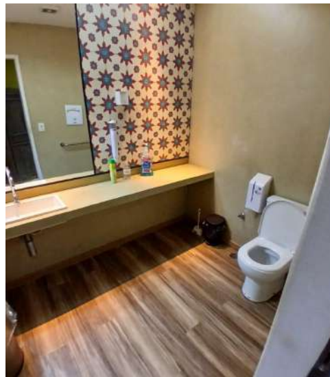
Figura 6 - Banheiro com adaptação para pessoas com deficiência (PCD).

Além disso, o restaurante conta com dois banheiros (Figura 6), um feminino e outro masculino, ambos adaptados para pessoas com deficiência (PCD), garantindo acessibilidade e conforto para todos os clientes.