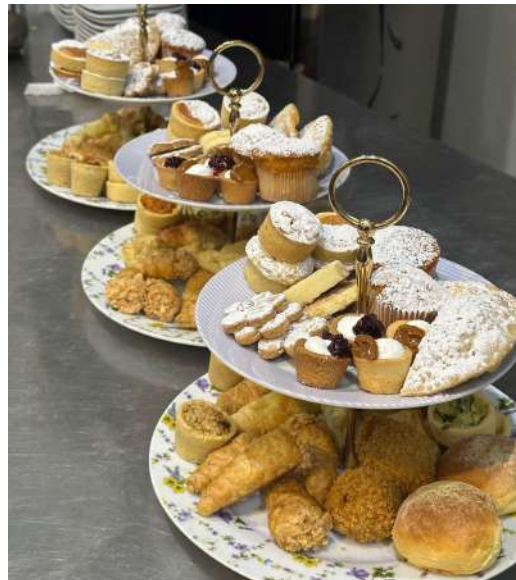
Figura 23 - Bailarinas do chá da tarde.

doces e bolos até strudel , fondant e uma variedade de salgados, como folhados e quiches. Durante esse processo, foi possível finalizar as bailarinas (Figura 23), um dos carros-chefes da casa durante o período do chá da tarde, assegurando um acabamento impecável para essa especialidade, muito apreciada pelos clientes.