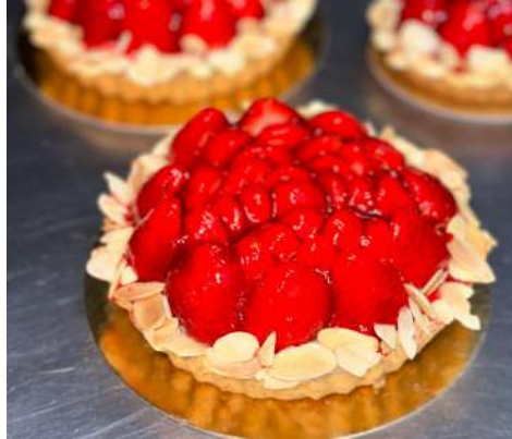
Figura 27 - Tarte de morango.

A produção também envolvia o preparo de bolos caseiros, como o bolo de chocolate e o de laranja, além de tartes de maçã com canela, tarte de morango (Figura 27) e uma variedade de folhados.