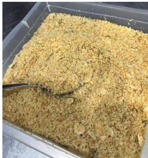
Figura 17 - Farofa de panko pronta.

Com o fogo controlado, a mistura era dourada gradualmente, sempre sob constante movimentação, até atingir uma coloração desejada e uma textura crocante, após atingir o ponto ideal, eram adicionadas amêndoas laminadas já torradas. Por fim, a farofa era armazenada em potes plásticos transparentes, em temperatura ambiente, até o momento do serviço (Figura 17).