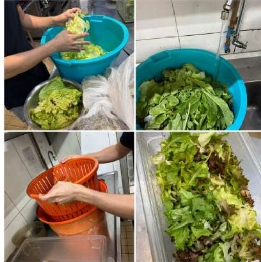
Figura 11 - Processo de lavagem e seleção do mesclun .

eram então armazenados em uma câmara resfriada, mantendo a temperatura adequada para a conservação dos vegetais até sua utilização na montagem de saladas e outros preparos do restaurante.