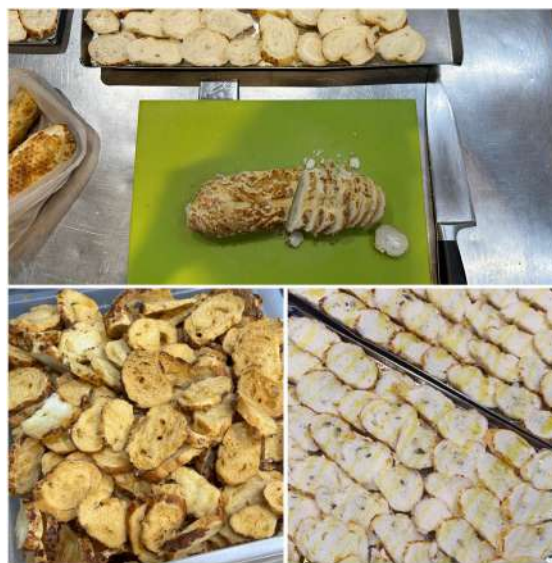
Figura 19 - Produção das torradas da casa.

Após o tempo de forno, as torradas eram resfriadas e armazenadas em potes plásticos (Figura 19), facilitando o serviço e garantindo que permanecessem crocantes. Essas torradas eram utilizadas como acompanhamento para entradas como o queijo brie empanado na massa folhada com geléia de frutas vermelhas e em antepastos como o de berinjela ou o de sardela .