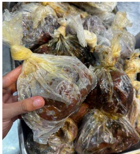
Figura 21 - Porcionamento do tomate seco.

Após a finalização, os tomates temperados eram pesados em porções de quinhentos gramas e embalados em sacos plásticos (Figura 21). As embalagens eram então armazenadas na câmara fria, garantindo sua conservação até o momento do uso.