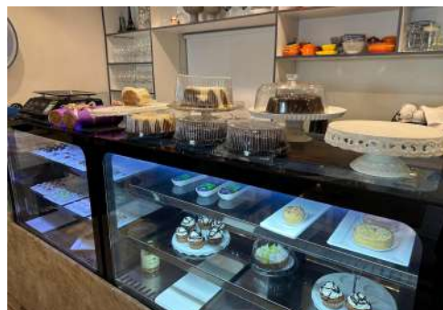
Figura 9 - Vitrine.

Conta também com uma vitrine para exposição dos doces, salgados, folhados e bolos (Figura 9); um balcão de apoio e uma máquina para produção de cafés. Atrás da vitrine de produtos, há uma janela que oferece uma visão privilegiada do setor de produção da pâtisserie , proporcionando aos clientes um vislumbre do processo artesanal de cada item preparado.