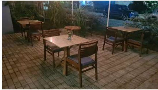
Figura 7 - Área externa em 2022.