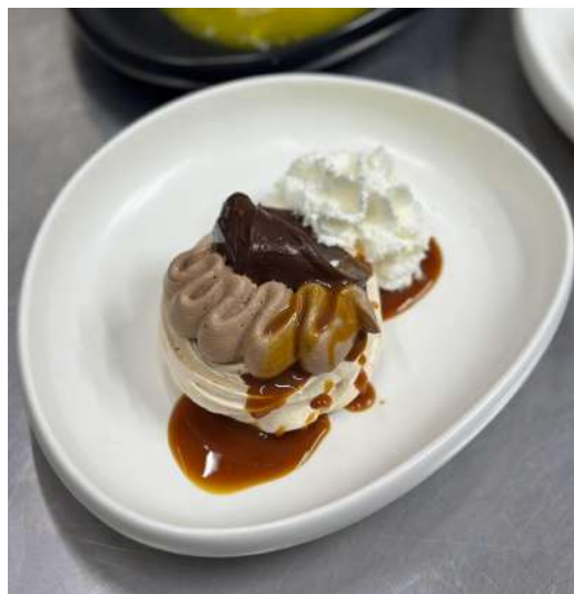
Figura 24 - Pavlova de chocolate com caramelo salgado.

Além disso, a responsabilidade incluía o preparo e a finalização de diversas sobremesas. Entre elas, destacava-se a “Pavlova de chocolate” com caramelo salgado (Figura 24), composta por uma mini pavlova , acompanhada de ganache de chocolate 53%, uma ganache montada com chantilly , caramelo salgado e chantilly .