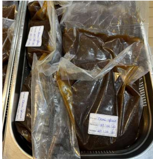
Figura 22 - Porcionamento do demi-glace .