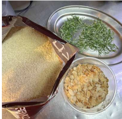
Figura 16 - Mise En Place da farofa de panko .