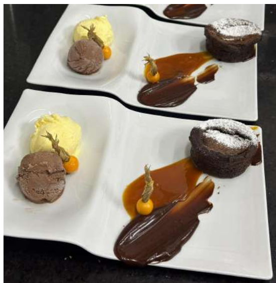
Figura 26 - Fondant com duo de sorvete.

O “ Fondant com duo de sorvete” (Figura 26), composto por um mini fondant , acompanhado de ganache de chocolate 53%, caramelo salgado, physalis e duas bolas de sorvete, uma de chocolate ao leite e outra de creme.