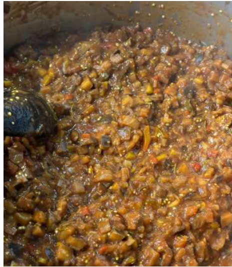
Figura 14 - Antepasto de berinjela.