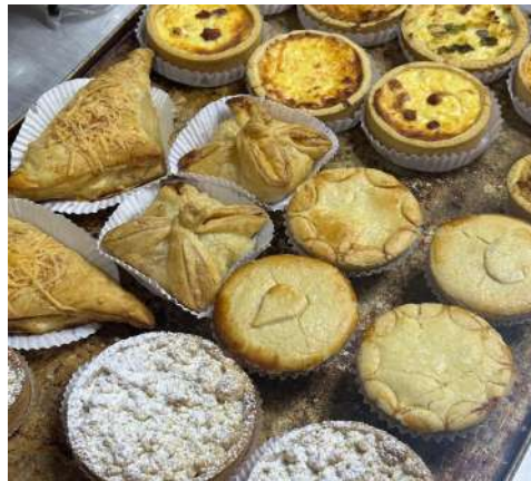
Figura 28 - Produtos finalizados para vitrine.

Entre os salgados, destacavam-se a trouxinha de frango e o folhado de peito de peru com ricota, assim como diversas opções de quiches, incluindo sabores como tomate seco, alho-poró, bacon e três queijos. Outras especialidades da casa incluíam empadas de palmito e camarão (Figura 28).