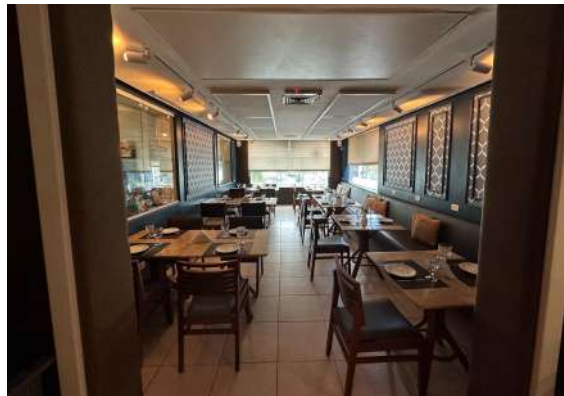
Figura 2 - Salão principal.

A casa acomoda, em média, 70 comensais, com mesas organizadas para atender grupos de diferentes tamanhos, incluindo opções para duas, quatro, seis e oito pessoas. O salão principal é totalmente climatizado e possui um layout cuidadosamente planejado para oferecer conforto e privacidade aos clientes (Figura 2). O espaço conta ainda com duas amplas janelas voltadas para a área externa do restaurante, permitindo a entrada de luz natural quando desejado. Para maior controle da iluminação e privacidade, as janelas estão equipadas com cortinas persianas, que podem ser ajustadas conforme a necessidade.