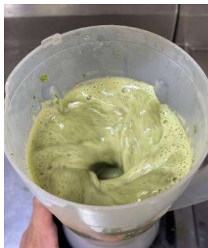
Figura 13 - Produção do extrato de hortelã.

O extrato de hortelã passava pelo processo de extração do seu suco para otimizar seu sabor no preparo das bebidas. Após ir a lavagem em água corrente, as folhas eram separadas dos talos, garantindo que apenas as partes mais aromáticas fossem utilizadas, em seguida, as folhas eram trituradas com uma pequena quantidade de água no liquidificador até formar um líquido homogêneo e concentrado (Figura 13). Essa mistura era coada em uma peneira fina, separando os líquidos dos resíduos sólidos para obtenção do suco límpido. O suco concentrado resultante era armazenado em recipiente de alumínio, embalado em plástico filme e mantido sob refrigeração na câmara fria, pronto para ser utilizado na finalização dos sucos.