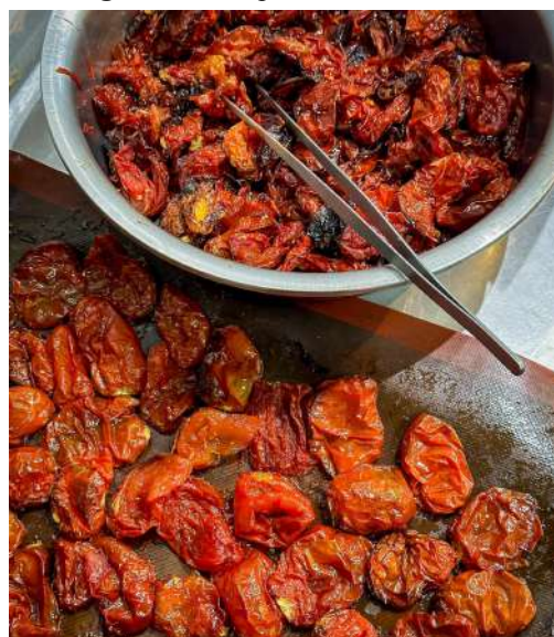
Figura 20 - Preparo do tomate seco.

Em seguida, os tomates eram dispostos com a casca virada para baixo em assadeiras forradas com tapete de silicone e levados ao forno em temperatura baixa (90°C) para um cozimento lento e gradual, permitindo que perdessem água sem queimar, durante esse processo, era necessário monitorar a cocção e virar os tomates periodicamente para garantir uma desidratação uniforme (Figura 20).