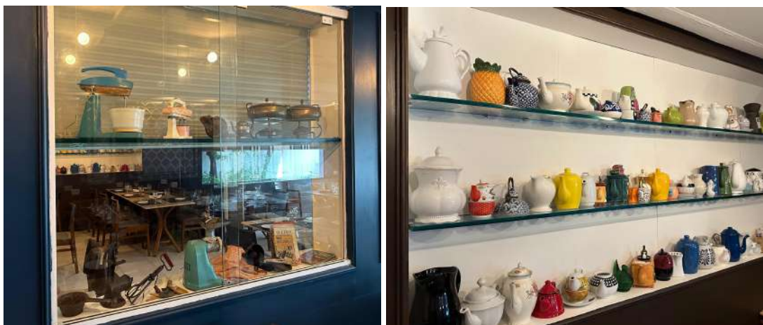
(B) Decoração de louça.