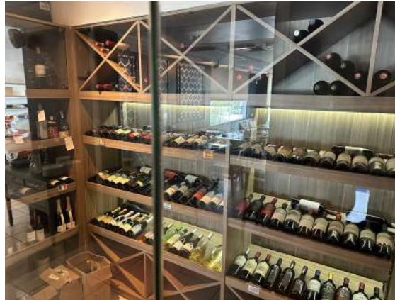
Figura 5 - Adega de vinhos.

harmonizar com o menu da casa. Seu design permite que os clientes apreciem a diversidade dos vinhos disponíveis, tornando a experiência gastronômica ainda mais envolvente.