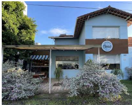
Figura 1 - Fachada do restaurante em 2023.

A fachada do restaurante, mesmo após a reforma, manteve o charme original de uma casa, complementada por um jardim na parte frontal. A figura 1 mostra a fachada do restaurante em 2023, cuja estrutura se mantém praticamente inalterada, com as principais mudanças sendo uma nova coloração e a ampliação do toldo na parte frontal, proporcionando maior cobertura. O espaço é bem distribuído em quatro áreas distintas, oferecendo aos clientes a opção de desfrutar do salão principal, do salão para eventos, da área externa ou da boutique gastronômica.