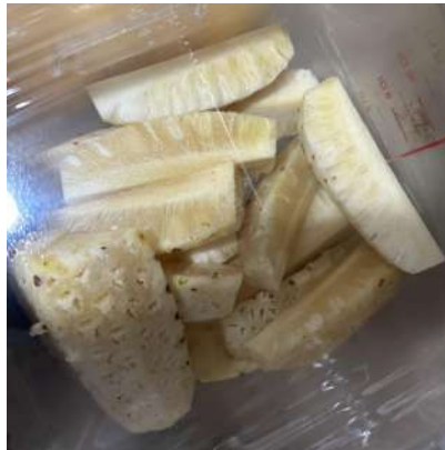
(A) Armazenamento do abacaxi.