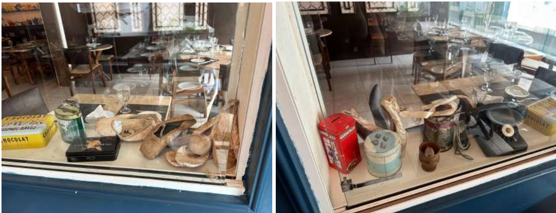
(A) Sapatilhas de ballet da Chef .