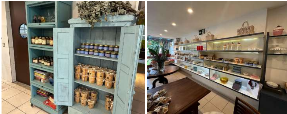
Figura 8 - Espaço para comercialização de produtos exclusivos do restaurante.

Além dessas áreas, o bistrô dispõe de uma boutique charmosa, onde os clientes podem adquirir mini louças, porcelanas, geleias artesanais, biscoitos, bolos e antepastos (Figura 8), permitindo que levem um pedacinho da experiência única do Oma para casa.