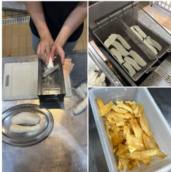
Figura 18 - Processo de preparo do chips de macaxeira.

Quando atingiam um tom dourado e uma textura crocante, os chips eram retirados do óleo e deixados escorrer sobre papel absorvente para eliminar o excesso de gordura. Ainda quentes, eram temperados com sal e, para preservar sua crocância até o momento do serviço, armazenados em potes plásticos forrados com papel absorvente (Figura 18).