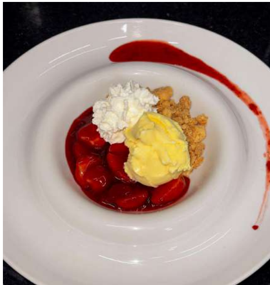
Figura 25 - Morango Fresco.

A montagem da sobremesa “Morango Fresco” também fazia parte das atividades realizadas (Figura 25), composta por morangos frescos envolvidos em uma mistura de geléia de morango, gel de brilho e pasta saborizante da fruta. A sobremesa era acompanhada de crumble crocante, sorvete de creme e chantilly .