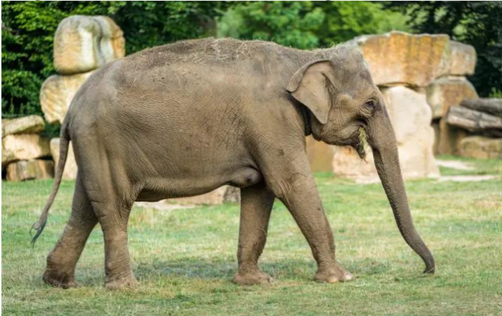
Imagem 1. Foto de um elefante asiático ( Elphas maximus ) fêmea, chamada Janita, do Zoológico de Praga