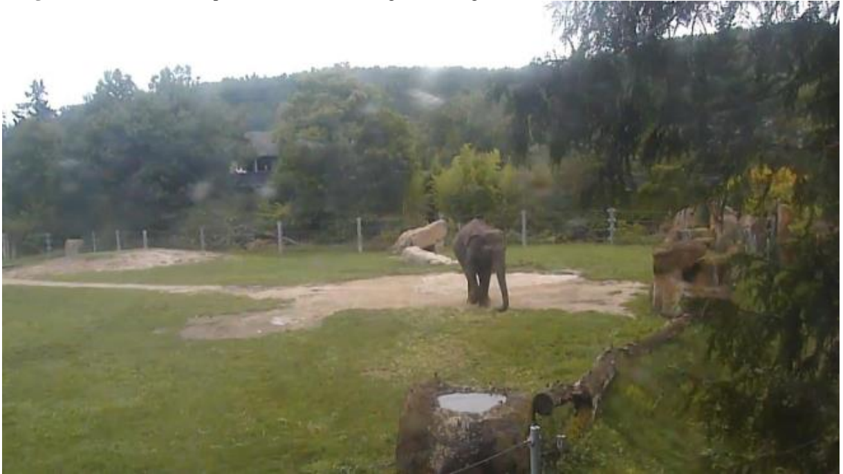
Imagem 3- Visão fornecida pela câmera 5 do Zoológico de Praga.