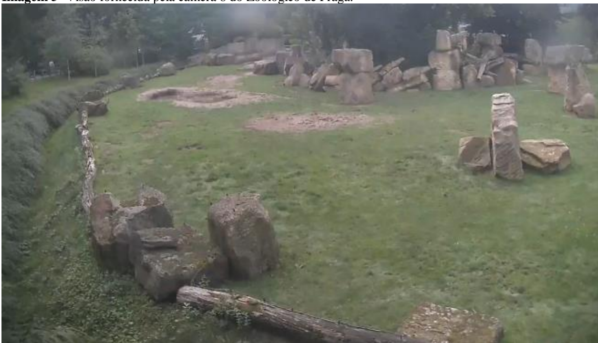
Imagem 5- Visão fornecida pela câmera 8 do Zoológico de Praga.