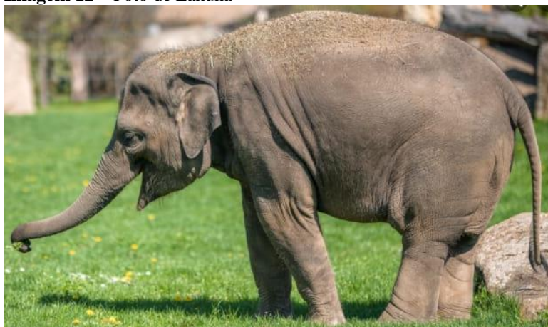
Imagem 12 – Foto de Lakuna