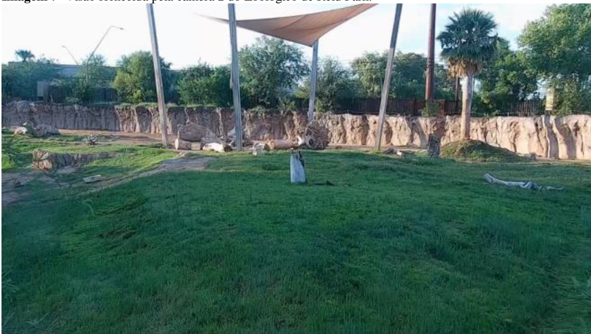
Imagem 7- Visão fornecida pela câmera 2 do Zoológico de Reid Park.