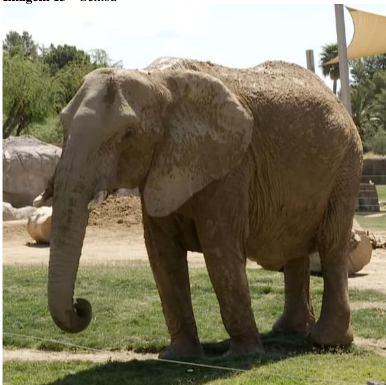
Imagem 13 – Semba