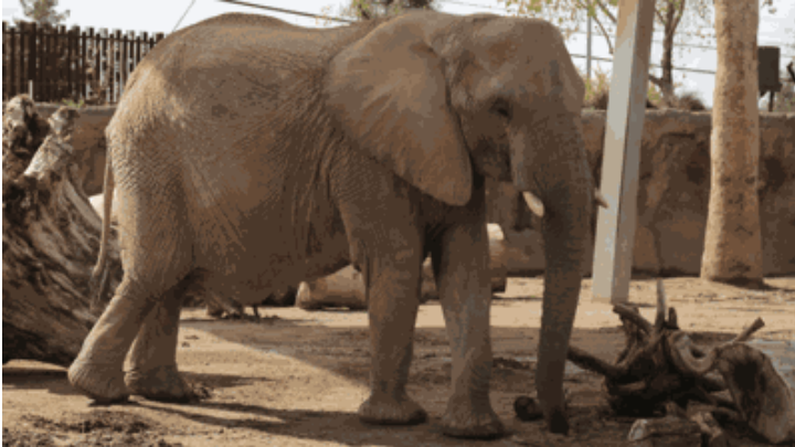
Imagem 2. Foto de um elefante africano ( Loxodonta africana ) fêmea, chamada Semba, do Zoológico Reid Park.