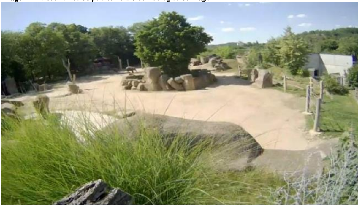
Imagem 4- Visão fornecida pela câmera 6 do Zoológico de Praga