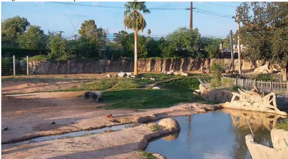
Imagem 6- Visão fornecida pela câmera 1 do Zoológico de Reid Park.