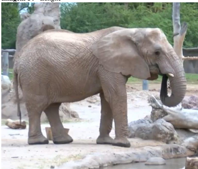
Imagem 14 - Lungile